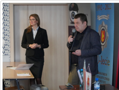
Rozmawiali o najnowszych zabezpieczeniach dokumentów