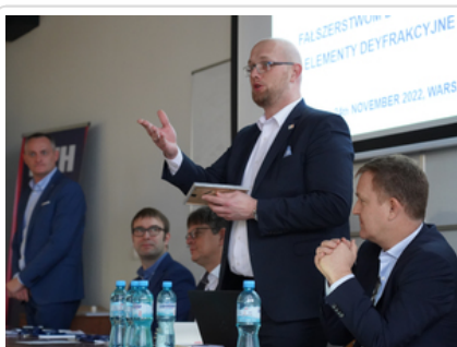
Rozmawiali o najnowszych zabezpieczeniach dokumentów