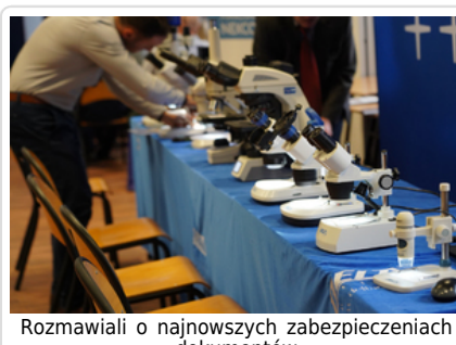
Rozmawiali o najnowszych zabezpieczeniach dokumentów