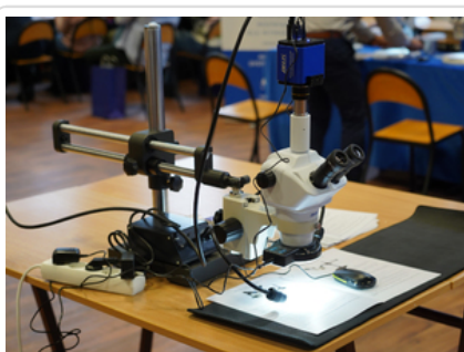
Rozmawiali o najnowszych zabezpieczeniach dokumentów