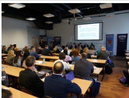
Rozmawiali o najnowszych zabezpieczeniach dokumentów