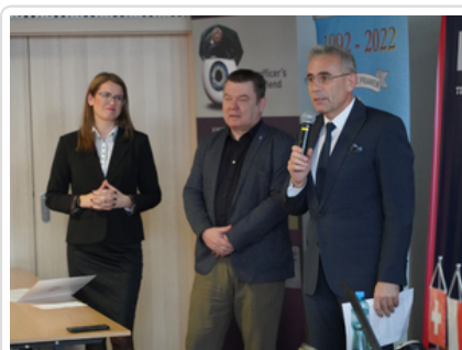
Rozmawiali o najnowszych zabezpieczeniach dokumentów