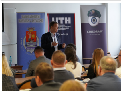
Rozmawiali o najnowszych zabezpieczeniach dokumentów

Projekt Komendy Stołecznej Policji „Dokumenty - bezpieczeństwo i kontrola, w tym kontrola taktyczna”, realizowany jest w partnerstwie z norweskim Nasionalt ID-senter oraz Polską Wytwórnią Papierów Wartościowych. Projekt finansowany jest z Programu „Sprawy Wewnętrzne” w ramach Funduszy Norweskich na lata 2014-2021. Program pozostaje w dyspozycji Ministra Spraw Wewnętrznych i Administracji.