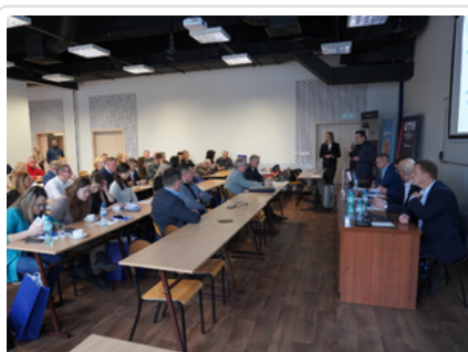
Rozmawiali o najnowszych zabezpieczeniach dokumentów