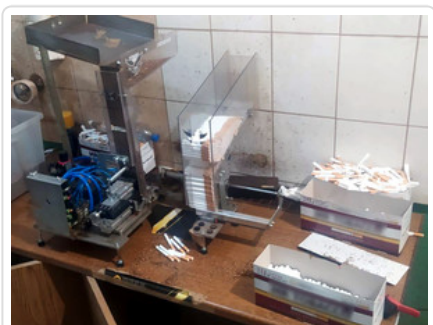
Nielegalne papierosy nie trafią na rynek