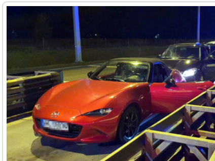
Przedmiot prowadzonych czynności

Film Kradli samochody w Niemczech i przewozili do Polski. Schemat ich działania był zawsze ten sam