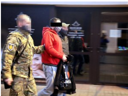
Policjanci prowadzą osobę zatrzymaną