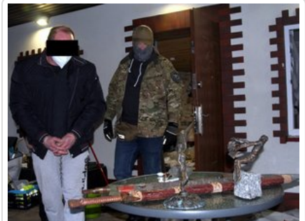
Policjant prowadzi osobę zatrzymaną