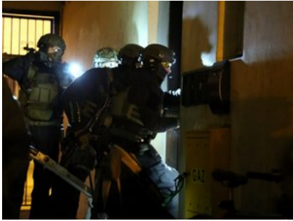
Policjanci kontrterrorystów podczas wykonywania czynności