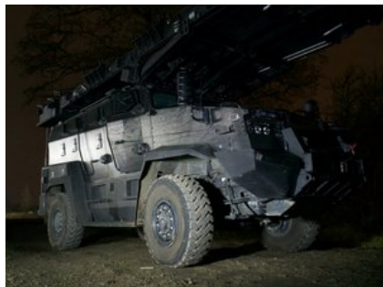
Specjalystyczny samochód policyjnych kontrterrorystów