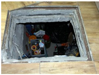
Skrytka w której przechowywane były skradzione przedmioty