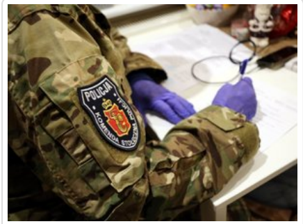
funkcjonariusz podczas sporządzania dokumentacji