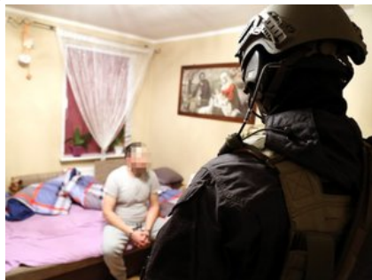
Policjant pilnuje osobę zatrzymaną