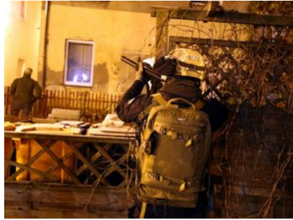
Policjanci kontrterrorystów podczas wykonywania czynności