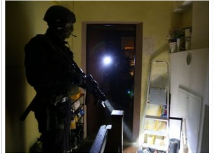
Policjanci kontrterrorystów podczas wykonywania czynności