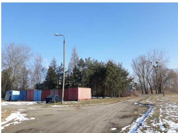
6. Stan drogi betonowej za wjazdem na plac manewrowy przed magazynami 05.03.2018 r.