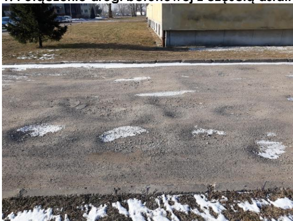
2. Stan drogi betonowej na dzień 05.03.2018 r.