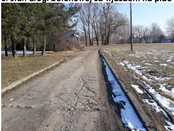
7. Stan drogi betonowej w kierunku starej kotłowni. Widoczna stacja terafo – wymaga remontu.