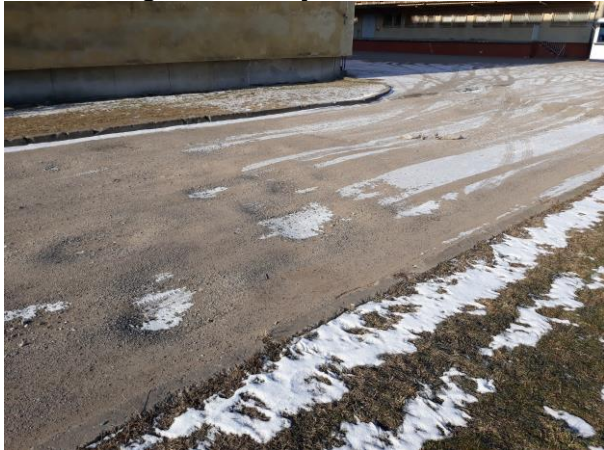
3. Stan drogi betonowej na dzień 05.03.2018 r.