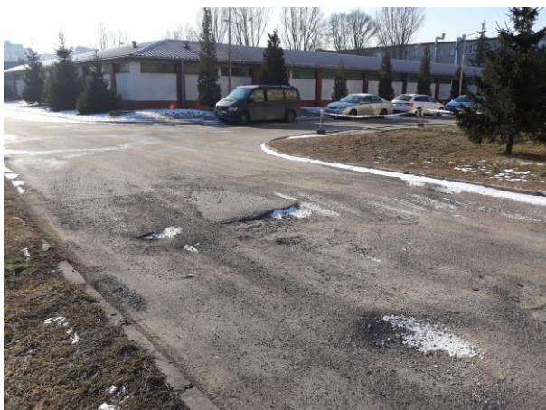
1. Połączenie drogi betonowej z częścią asfaltową – stan na dzień 05.03.2018 r.