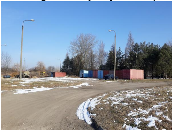
5. Stan drogi betonowej za wjazdem na plac manewrowy przed magazynami 05.03.2018 r.