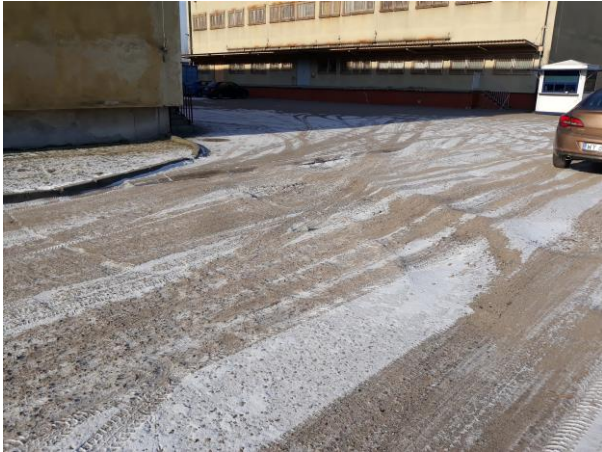
4. Styk drogi betonowej z placem manewrowym przed magazynami stan na 05.03.2018 r.