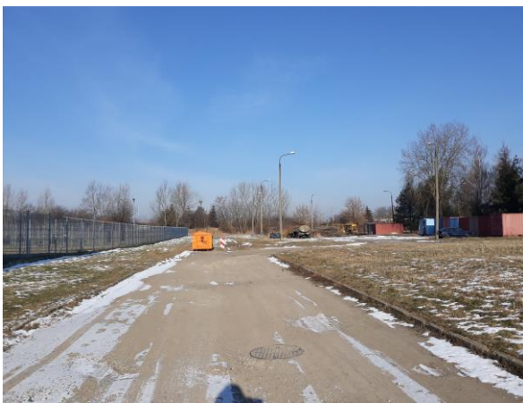
4. Stan drogi betonowej za wjazdem na plac manewrowy przed magazynami 05.03.2018 r.