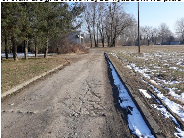
7. Stan drogi betonowej w kierunku starej kotłowni. Widoczna stacja terafo – wymaga remontu.