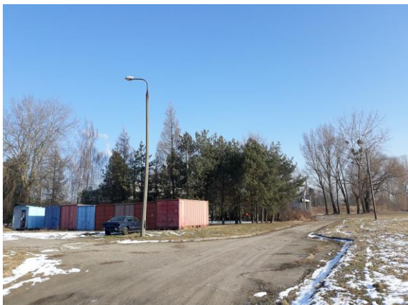
6. Stan drogi betonowej za wjazdem na plac manewrowy przed magazynami 05.03.2018 r.