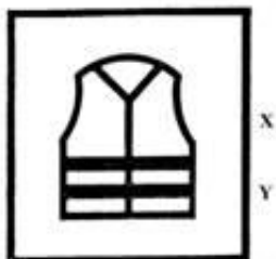
Rys. 2 Znak graficzny dla odzieży ostrzegawczej gdzie:

X – oznacza klasę odzieży ze względu na zastosowaną wielkość powierzchni materiału tła i materiału odblaskowego wg PN- EN ISO 20471:2013-07 lub równoważnej