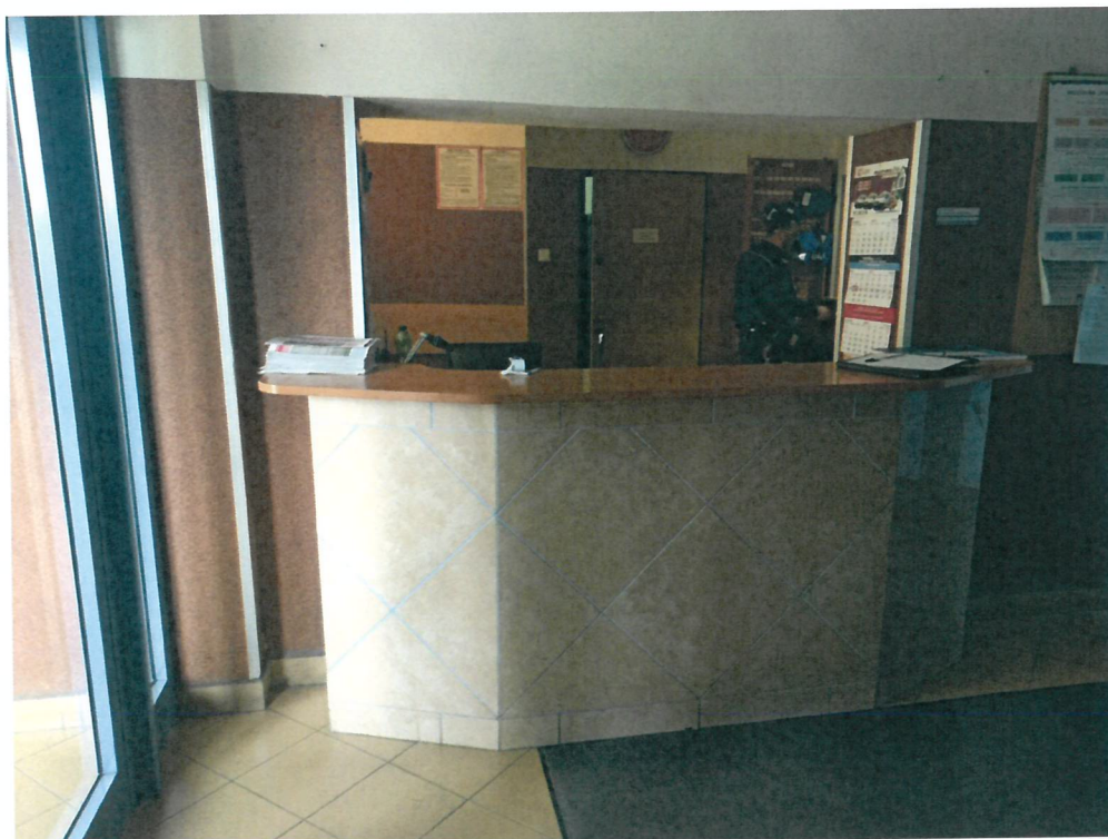
Fot. 1 lada w recepcji od strony poczekalni