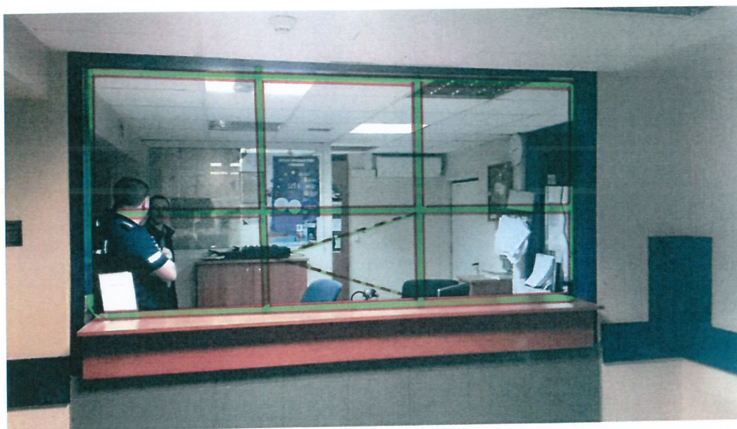
Fot. 4 rysunek poglądowylokalizacji zabudowy aluminiowo-szklanej

Stałą przegrodę o konstrukcji aluminiowo-szklanej należy wykonać jako pełną zabudowę, montowaną w istniejącym otworze. Szklaną zabudowę należy wykonać z szyby bezpiecznej, laminowanej, o krawędziach szlifowanych - 44.4, klasa wytrzymałości P4A. Konstrukcja aluminiowo – szklana z otwieranym do wewnątrz recepcji oknem podawczym o wymiarach 70x80cm, z klamką na klucz. Profile aluminiowe malowane proszkowo na kolor niebieski (RAL należy dopasować do istniejącej kolorystyki ceownika przy oknie, należy przewidzieć ponowne pomalowanie ceownika przy jego uszkodzeniu podczas montażu).