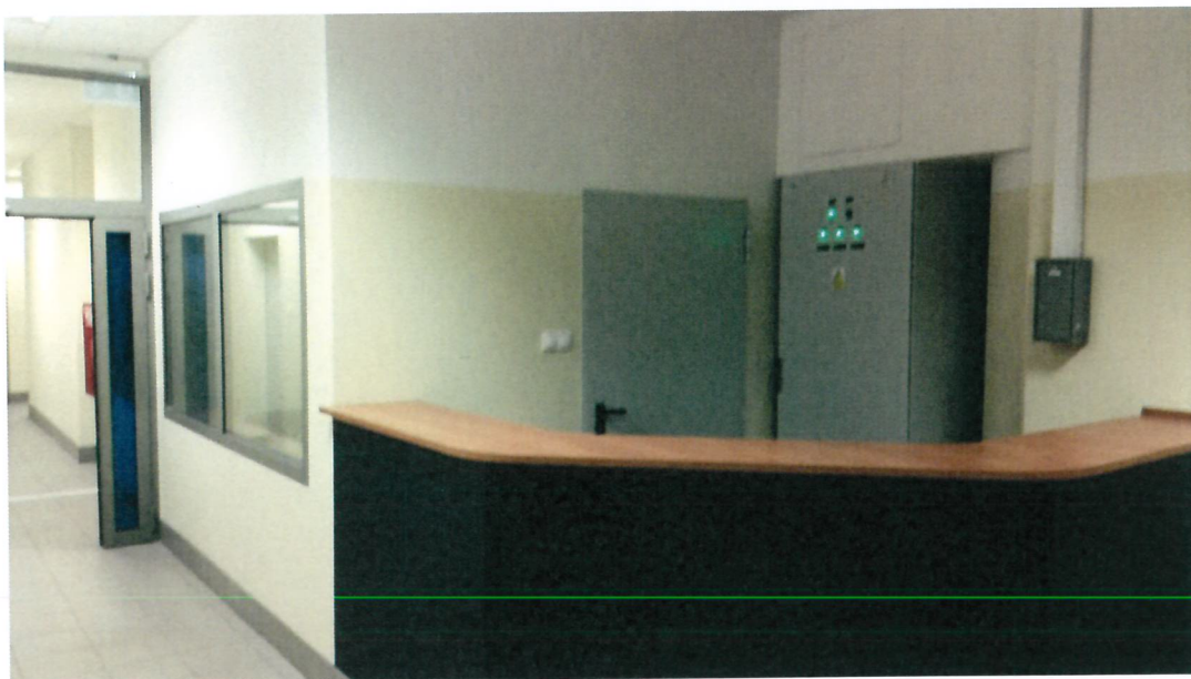
Fot. 1. istniejąca lada w recepcji od strony poczekalni

Lada oddziela punkt recepcyjny od pomieszczenia poczekalni. Lada jest wykonana jako ściana łamana, o konstrukcji żelbetowej, o gr. 29 cm, wys. 116,5 cm i długości 402 cm. Wierzch ściany jest wykończony blatem z płyty meblowej o szerokości 40cm.