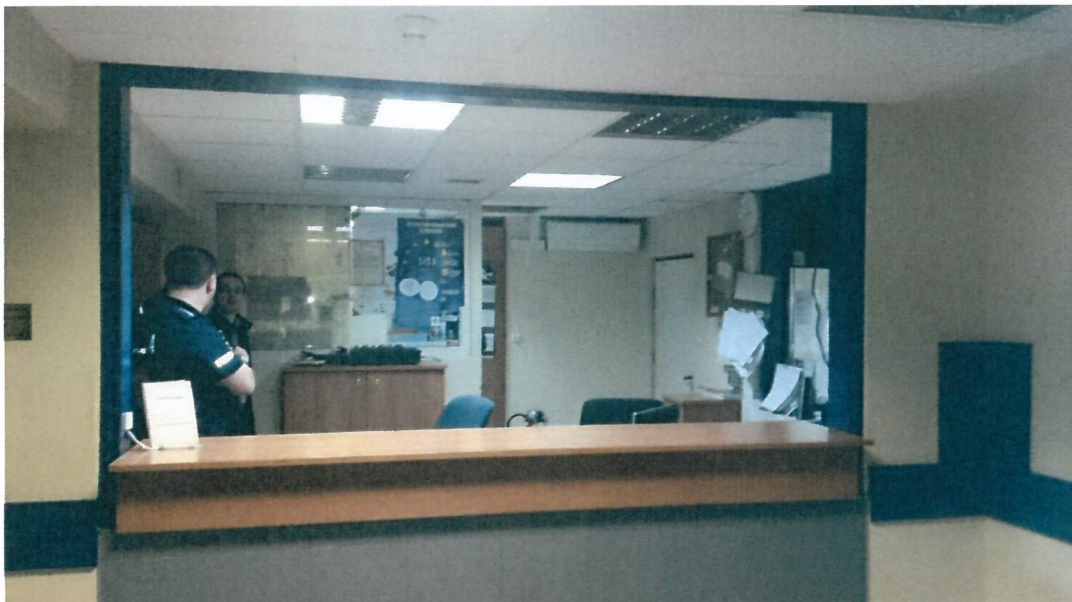
Fot. 3 lada w recepcji od strony poczekalni

W recepcji znajduje się lada, której podstawą jest ściana o konstrukcji murowanej (żelbetowej?) o wysokości 100 cm. Wykończona jest płytą zabudową z płyty meblowej o wysokości 22 cm i długości 241 cm