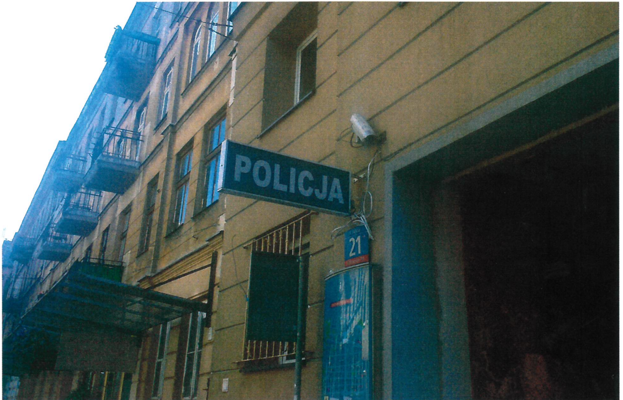
Rys.1 Istniejący kaseton przeznaczony do demontażu:

Montaż semafora na ścianie zewnętrznej (elewacja wykończona tynkiem z warstwą styropianu gr. 12cm) przy wejściu głównym po lewej stronie, prostopadle do ściany. Wysokość montażu wynosi 300 cm od poziom terenu do dolnej krawędzi semafora. Kaseton należy podłączyć do istniejącej instalacji budynku. Z uwagi na istniejącą kamerę należy odsunąć semafor od elewacji około 25cm. Sposób mocowania należy indywidualnie zaprojektować (sugerowany jest montaż do ściany na dwóch wspornikach ze stali nierdzewnej). Ostateczny sposób montażu wraz z projektem, zostanie przedstawiony Zamawiającemu do akceptacji. Akcesoria montażowe semafora gwarantujące stabilną pracę w trakcie całego okresu użytkowania. Przed montażem należy zdemontować stary semafor-1 sztuka. Semafor należy wykonać w szczelnej konstrukcji w technologii gwarantującej odporność na warunki atmosferyczne oraz promieniowanie UV.