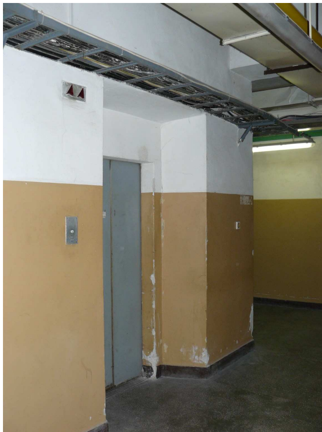
Poziom -1 dojście do windy