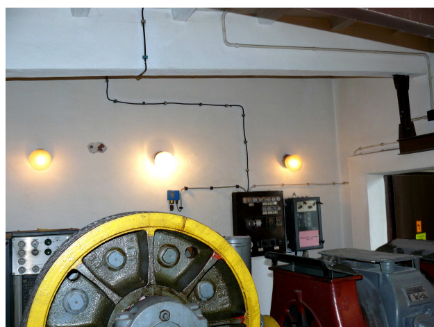
Szafy sterownicze dźwigu