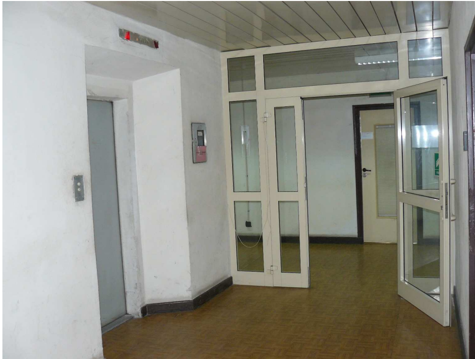
Parter dojście do windy