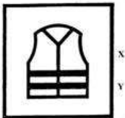
Rys. 2 Znak graficzny dla odzieży ostrzegawczej gdzie:

X – oznacza klasę odzieży ze względu na zastosowaną wielkość powierzchni materiału tła i materiału odblaskowego wg PN-EN 471:2005 (1-3),