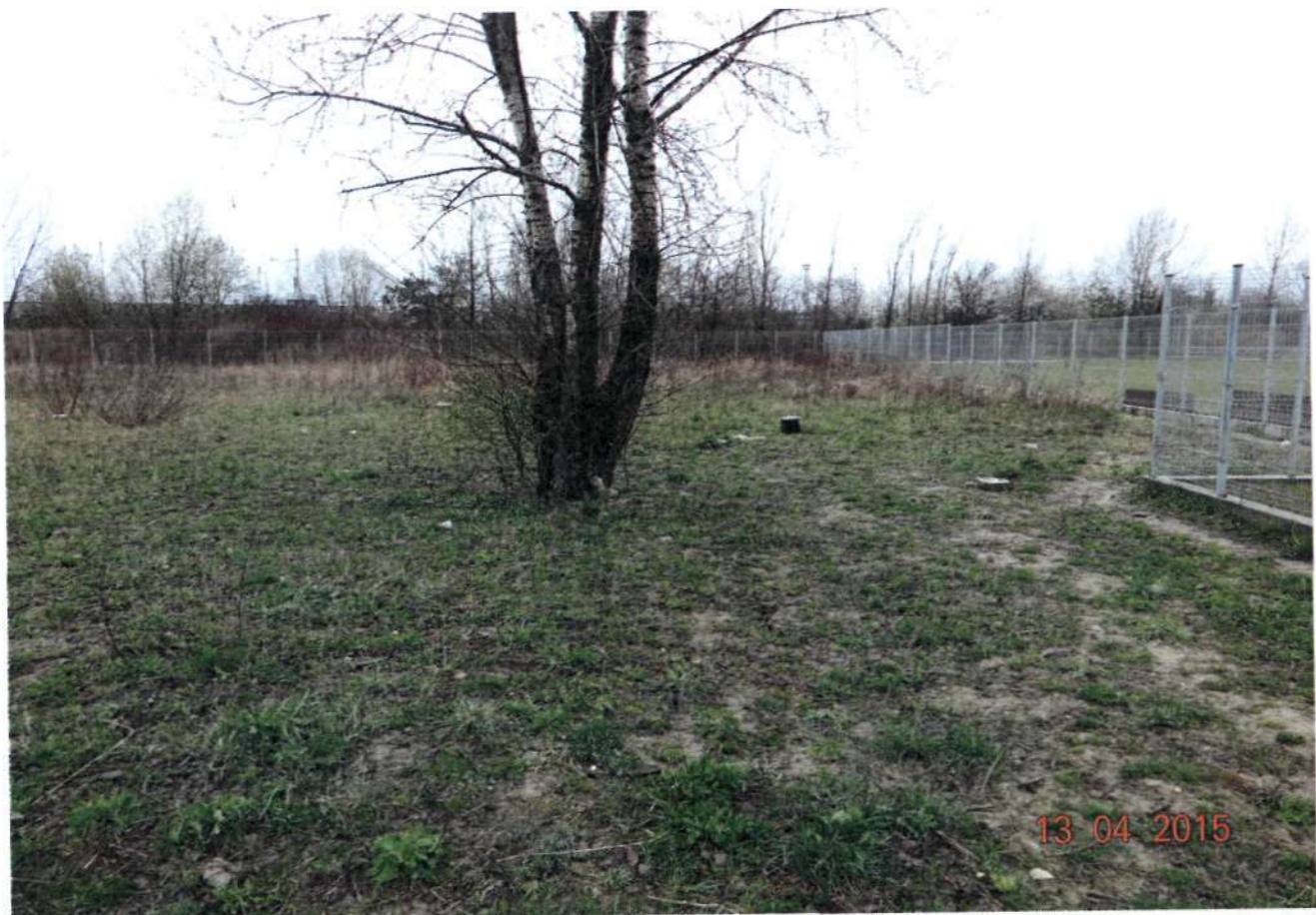
fot 1 – 2 . - TEREN ĆWICZEŃ - wybieg dla psów przeznaczony do rekultywacji, /nr 1 wg szkicu - pow. 3360 m 2 /