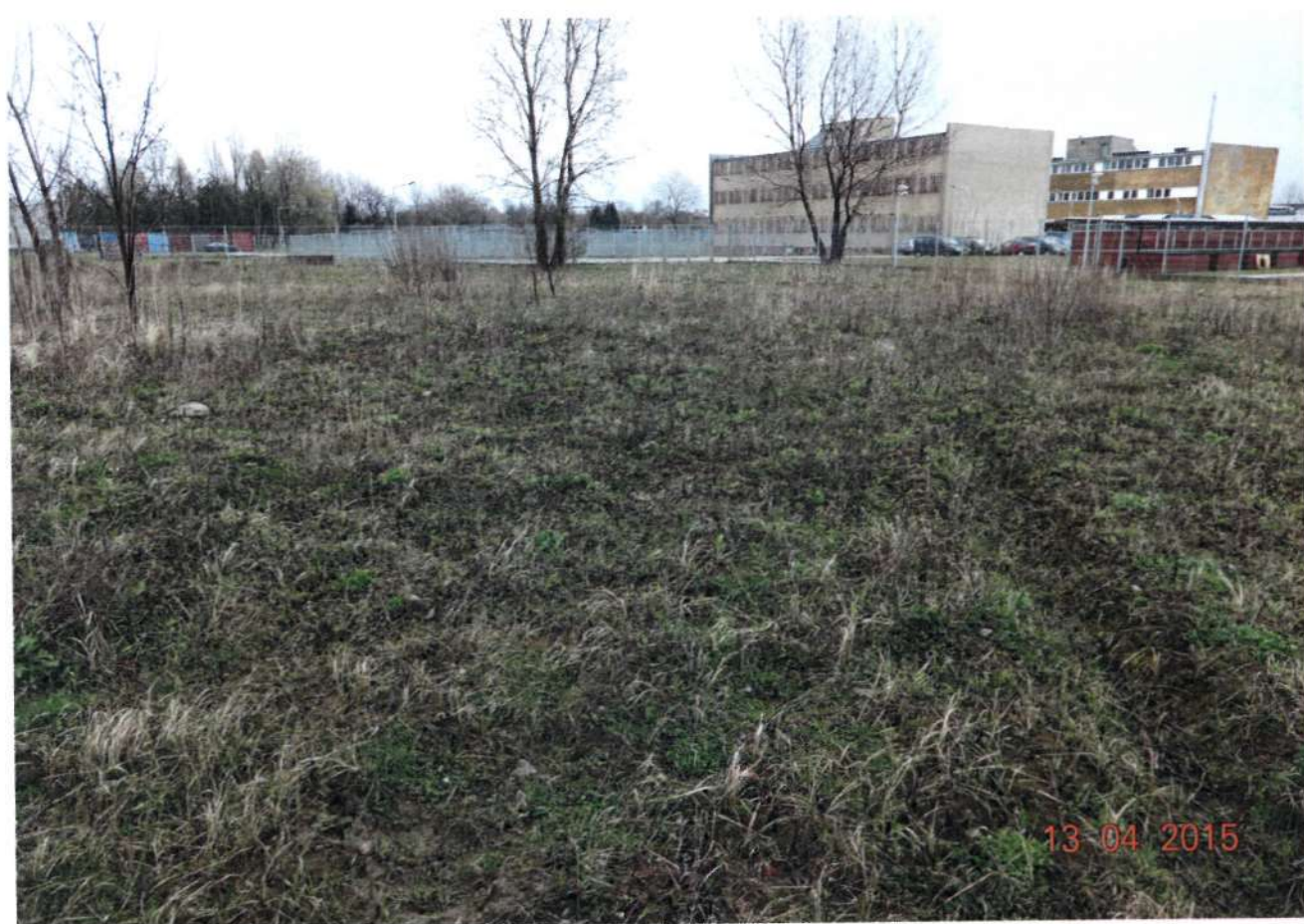
fot 3 -4 . - TEREN ĆWICZEŃ - wybieg dla psów przeznaczony do rekultywacji, /nr 1 wg szkicu - pow. 3360 m 2 /