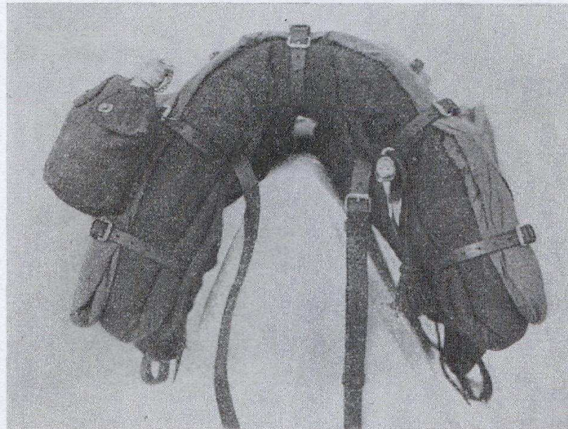
Ryc. 20. Stroczone siodło wz. 36 — widok z przodu.