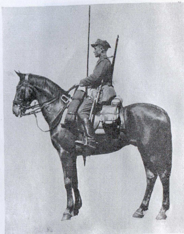
Ryc. 12. Szeregowiec sekcji liniowej — konno.