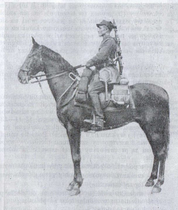
Ryc. 13. Szeregowiec sekcji r. k. m. z r. k. m. — konno.