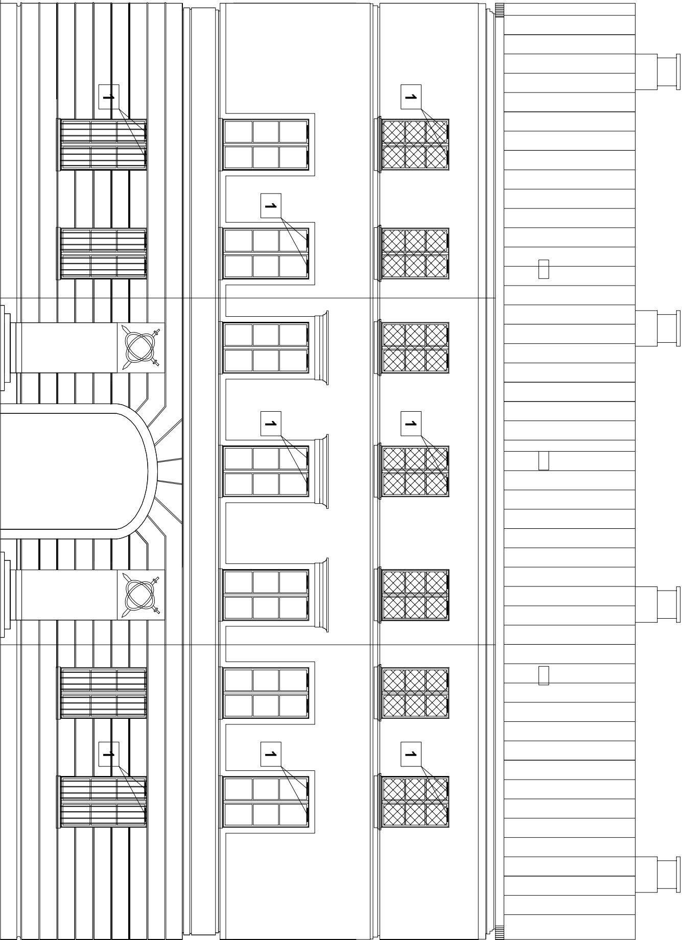
TYP UKŁADU OKIEN